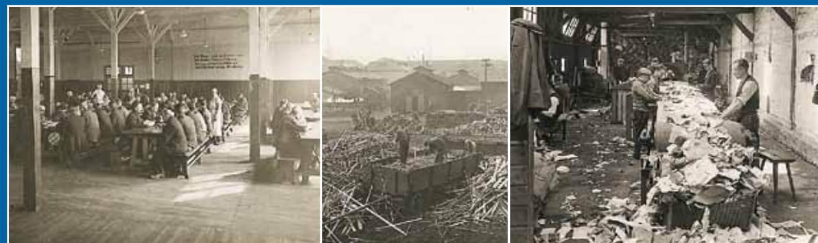
Der Ursprungsverein „Lokalverein wider die Vagabundennoth“ bot Durchreisenden und Arbeitslosen Wohn- und Schlafplätze sowie Verpflegung und Arbeit.