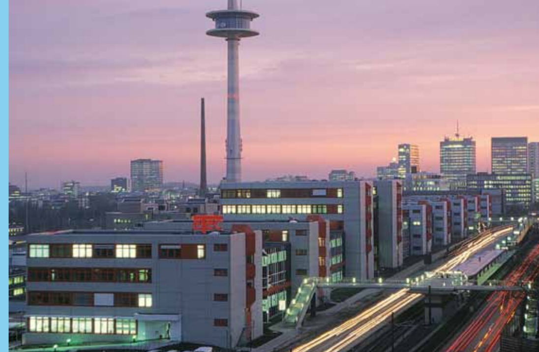
Eine moderne Stadt im Zeichen der sozialen Kompetenz.

Für die Zukunft nehmen wir uns selbst in die Verantwortung und werden unsere umfangreichen Erfahrungen im Bereich der sozialen Dienstleistungen nutzen, um innovative Wohnkonzepte für eine sich wandelnde Gesellschaft voranzubringen.